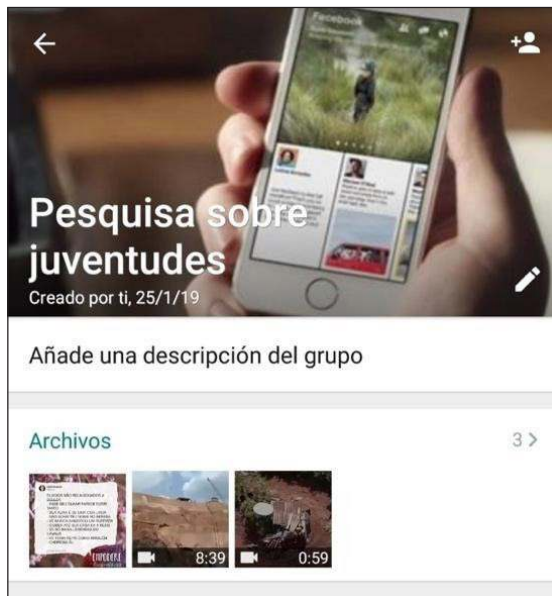
Figura 1: Print del grupo creado en WhatsApp

Esta pista nos llevó a otro movimiento: direccionar miradas para las políticas públicas para las juventudes de Maranhão. En esta búsqueda, llegamos a los datos del Atlas de la Violencia del año 2017 , documento que destaca a las ciudades de Codó e Imperatriz entre los municipios con mayor vulnerabilidad de la población joven negra con relación a la violencia. A partir de este dato, nos profundizamos aún más en las búsquedas sobre las desigualdades en el Estado por medio de una lectura racial. Fue entonces que los datos presentes en el documento y en otros órganos de investigación destacaron a las mujeres negras en la cima de las desigualdades educacionales, sociales, económicas y políticas de Brasil. Este movimiento exploratorio fue crucial para el cambio y la justificación de un nuevo enfoque de investigación.