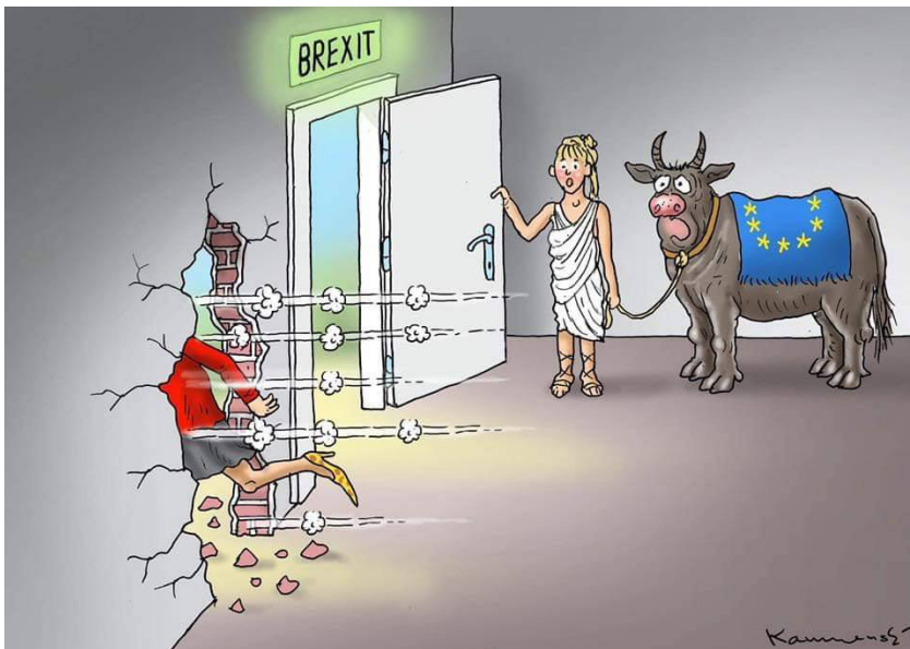
Figura 2. “Brexit” , cartoon da autoria de Marian Kamensky