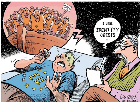
Figura 5. “I see. Identity crisis...”, cartoon da autoria de Chappatte