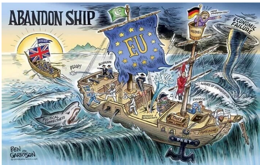
Figura 1. Abandon Ship, cartoon da autoria de Ben Garrison