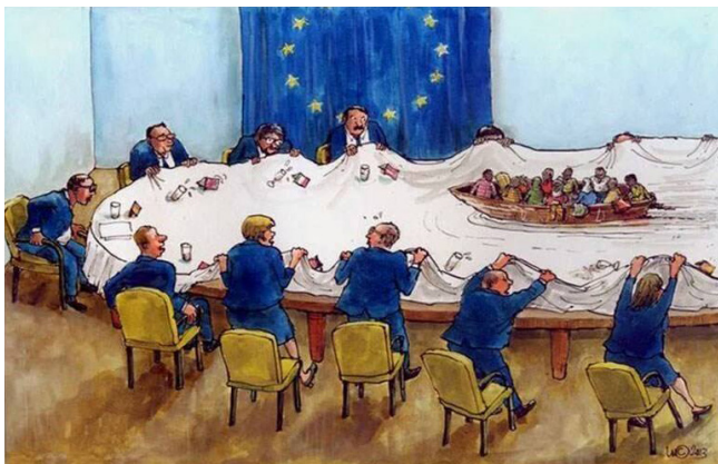
Figura 4. Sem título, cartoon da autoria de Luc Vernimmen